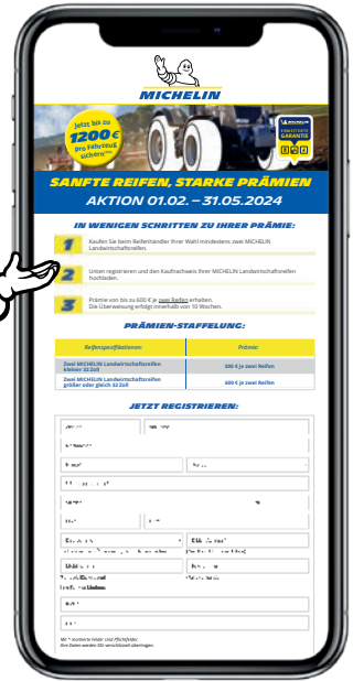
Abbildung und Inhalte ähnlich